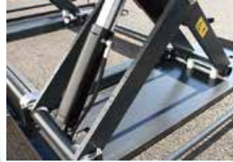
安心のロック機構採用

静的負荷150%で設計された高級品です。土間を作り、埋込型としても使用できます。