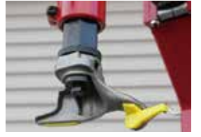
オリジナル形状のマウントヘッド