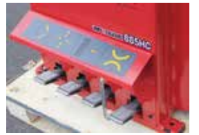
一目で分かるペダル配置