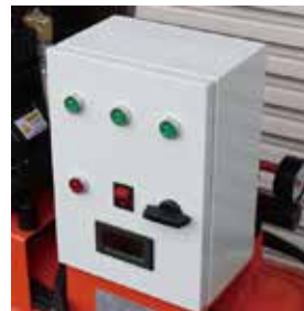
操作しやすいスイッチ