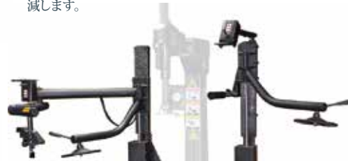
丁寧な作業を実現するダブルサポート

ダブルサポートアームやタイヤ用エレベーターが備わっている為、力を使わないで丁寧な作業を行う事ができます。