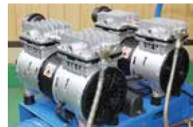
サイレンサー付きの静音モーター