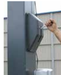
使いやすいレバー式ロック解除