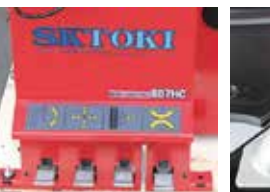
一目で分かるペダル配置