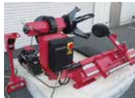
自由に移動できる操作パネル

ヘッドを自在に調整することができ、力を使わずに大きなタイヤを楽にセットできます。トラック用のアルミホイールもオプションを装着することで傷をつけずに作業を行います。