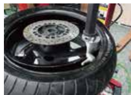
小径にも OK！マウントヘッド