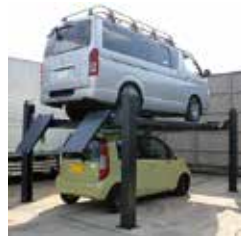
立体駐車場としても使用