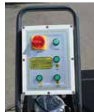
使いやすい操作パネル