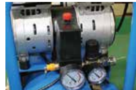
操作しやすいスイッチ