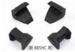
(新 885HC 用)