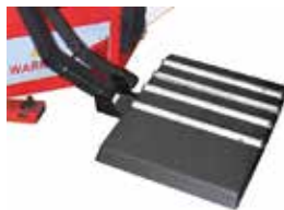
便利なタイヤエレベーター