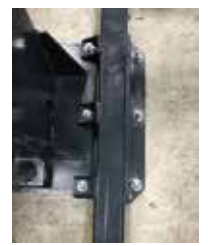
転倒防止用サイドバー (オプション)