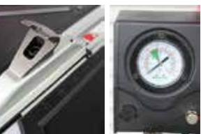
ブロースに耐える丈夫なチャック