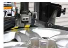
レバーレス専用のサポートアーム

887VHCにはレバーレス専用のサポートアームが装着されます。専用パーツとすることで、力仕事を減らし、作業を丁寧に行えます。