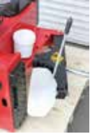
ビードブレイカー (プラスチックを取ってください)

サポートアームを使用することで、扁平タイヤやランフラットタイヤを楽に装着することができます。24インチクラスのタイヤを楽に組めるので、タイヤ販売店、輸入車専門店等であればサポートアーム付きをお勧めします。一緒に購入なら送料を安く抑えられます。