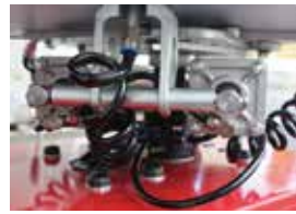
チャック用シリンダー