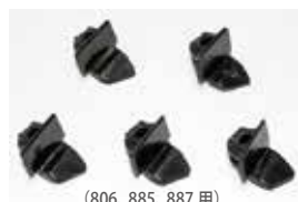
(806, 885, 887 用)