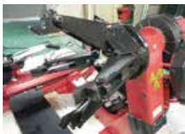
自在に動かせるヘッド