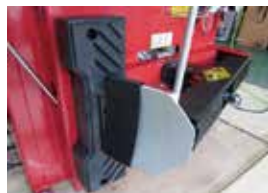
ビードブレーカー