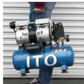
持ち運びに便利なハンドル