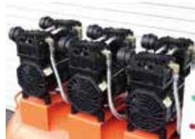
トリプルモーター 6気筒