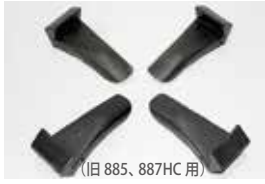
(旧 885、887HC 用)