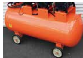
移動に便利なキャスター付