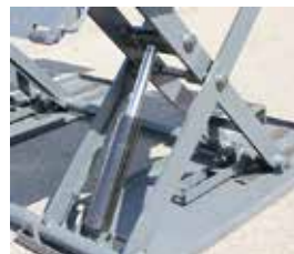
安心のロック機構