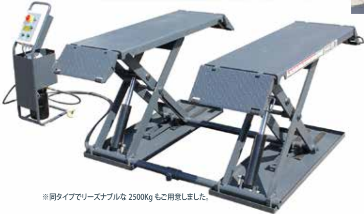
※同タイプでリーズナブルな 2500Kg もご用意しました。