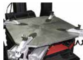
最大内掛け28インチ対応のテーブル

大径ホイールに最適なタイヤチェンジャーです。2つのプレスバーやディスクプレートを活用することで、難易度の高いタイヤの交換を素早く行え、作業者への負担をより軽減します。