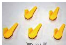
(885, 887 用)