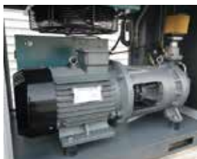
スクロール型コンプレッション