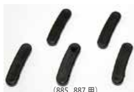
(885, 887 用)