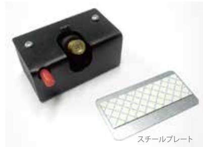
スチールプレート