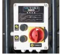
使いやすい操作パネル