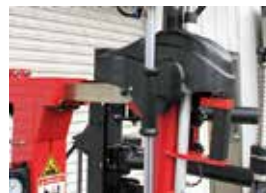
使い勝手の良い操作部分

自動でビードを起すことができるレバーレス仕様です。力を使わずに取り付けに集中することができ、丁寧な作業が行えます。ビードへの確にフィットするツールは、特殊なタイヤや扁平タイヤも、驚くほど簡単に組むことができます。