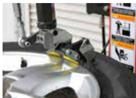
確実にフィットするツール