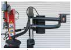
サポートアーム部分