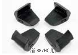
(新 887HC 用)