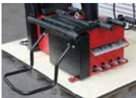
ホイールリフター