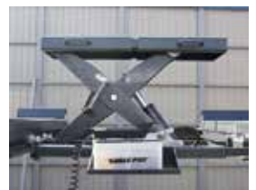
ローリングジャッキ (オプション)