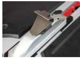
ブロースに耐える丈夫なチャック