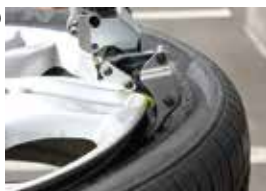
力を使わずにビードを起す